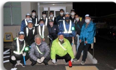
＜コミセンに戻って講評＞