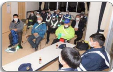
＜2班に分かれて撮影 北部班＞