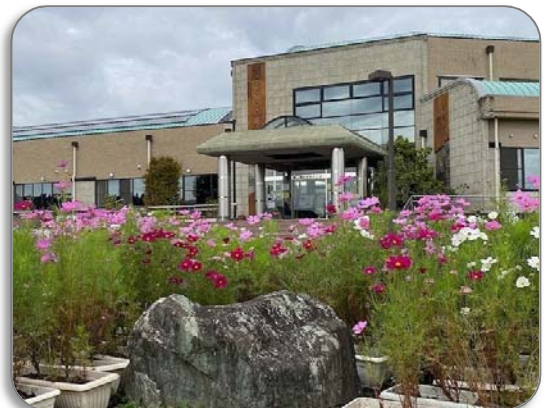
<満開のコスモス（城山地区市民センター）>