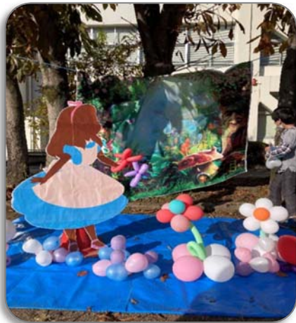
<フォトスポット 例>