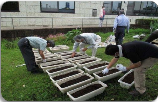
<種蒔き（プランター）>